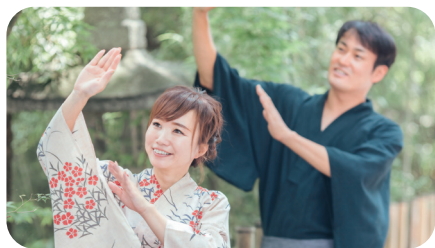
みやくはくおんど 脈博音頭